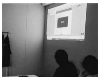
幹事会で「ダンカン」の説明