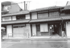
下京区松原通の一角