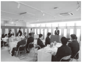
竣工式には長内繁樹豊中市長も駆け付けてきました