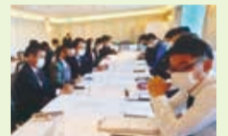
話に期待の雰囲気