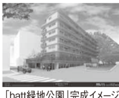
「hatt緑地公園」完成イメージ

「hatt緑地公園」計画は、築40年超の老朽マンションを「今後いかに活用していくか」模索する中で