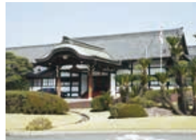
日管協フォーラム会場(明治記念館)