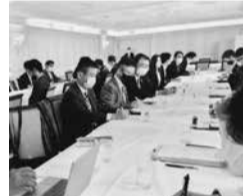
支部活動が報じられる定例会