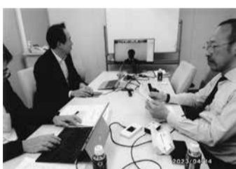
ズームの基地。いろいろな意見が映像を通して