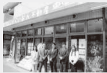
らいおん不動産の前で

弊社2025年ビジョンで「阪神エリアでナンバー1の不動産会社」を標榜。5年で売上高10億円、10年で100億円の企業を目指しております。