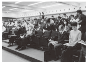
地元密着のオーナーセミナー

なり、実質ゼロで入会が可能に。この機に一気に会員増へと繋げたいという考えです。(一面参照)