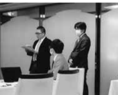
報告や新入会員紹介が行われる幹事会

用意は周到です。特に賃貸業界は社会背景に人口、世帯数の減少があり、これらにどう対峙していくのかのヒントも得たい場です。秋・冬期にかけて京都府の協力を得て「住まいの相談・賃貸住宅相談」は続行。