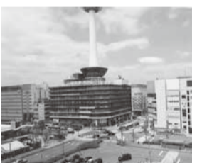
伝統の町に住みたい人へ

京都市都市計画局は京都市内で住みたい人を応援する「安すまパートナー」と称する事業者を募集。すまい探しやリフォームなどに詳しい地域の事業者が対象。「京都市すまいの事業者選定支援制度」が正式名で令和5年度の新規登録は4月17日(月)から受け付け5月19日(金)に締め切り。(結果は次号で)