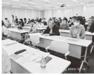
盛況のセミナー会場