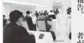
京都市から報告を聞く