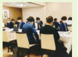
会議の中身は広く社員へ

確かに管理業といっても会社によって仕事や方向性は様々。それを会合の中で知り、伝わり、刺激を受ける。会社に持ち帰って社員に伝える。社員はそこで自らの感性を加えてプラス効果へ。「この好循環こそが大事」だと幹部は話す。講演会などでは立派なレジュメが、また交流する人との何気ない会話の中に大小の発見がある。他の会社の方向性を知る機会でもあり、これを社内会議などで検討の材料にする「おみやげ」の効果は大きいと。「貴重な時間・体験を社内で活かす」ことへの工夫をある幹部から聞きました。