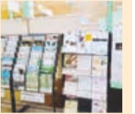
断熱へ多くの資料が

昨秋行われた賃貸住宅フェアでリフォーム業者から多くの新提案がありました。「住宅断熱リフォーム」「もう通常の冷房では限界、断熱仕様注目」などです。賃貸住宅の施工に、新築であれ、リフォームであれ、断熱仕様はより具体化へ。「快適な賃貸住宅生活」へ、また新しい仕様に加わっていきます。暑さに苦しんだ昨夏、この対策は進みそうです。