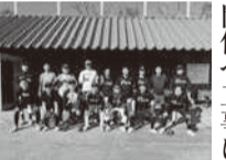
京都府支部チーム