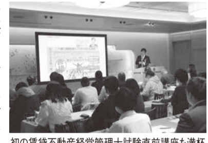
初の賃貸不動産経営管理士試験直前講座も満杯

日本賃貸住宅管理協会(塩見昭昭会長)が11月14日に東京都港区の明治記念館で開催した毎秋恒例の一大イベント「日管協フォーラム2023」は、ブース出展が過去最高の56社、参加者数が837社3130人で、2019年の3370人に迫るなど、コロナ収束後3年ぶりに完全対面開催復活となった23年フォーラムは大変な盛り上がりを見せました。近畿ブロックからの参加は53社152人のほ