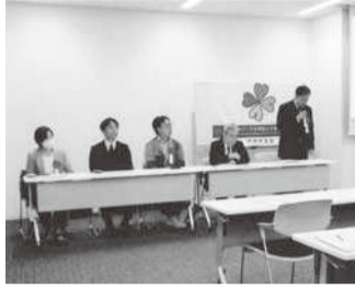
地元行政など各講師が並んで