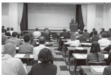
開始早々熱気に包まれたオーナーセミナー大阪会場

セミナーは大阪駅前徒歩2分の多目的ミーティングスペースAPホールIIで午後3時からスタート。影山支部長は冒頭、「時代とともに経営環境も変わる。90年代バブル期などは何もしなくても満室。しかし今は違う。(日管協賃貸住宅)メンテナンスマンナー研修も始まった。維持管理を通じて(管理の質向上へ)建物資産に精通しなければいけない時代」と述べ、「本日の講師はすべて女性。聞きや