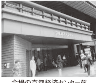
会場の京都経済センター前